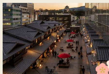
ミナカ小田原 (イメージ)

2020年にオープンした小田原駅の新名所 ミナカ小田原 でお買い物と自由昼食をお楽しみください♪