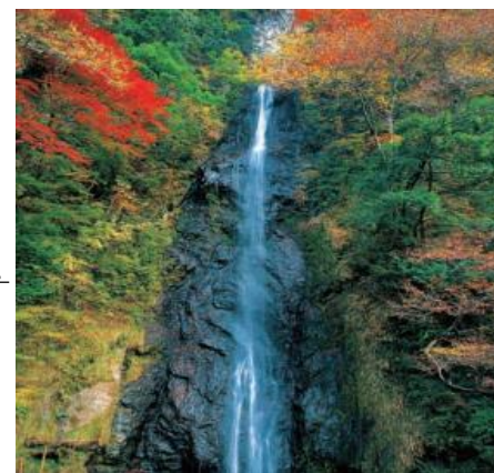
赤沢宿(羽衣白糸の滝)11月中旬