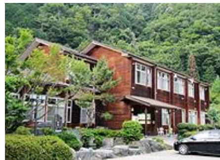
ヘルシー美里(旧早川北中学校校舎)