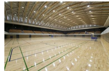
神栖市 かみす防災アリーナ(イメージ)