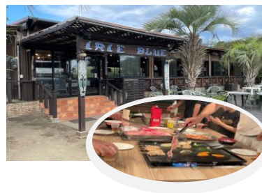
リゾートインあおのBBQランチ(イメージ)