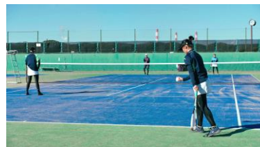
神栖市 海浜運動公園(イメージ)