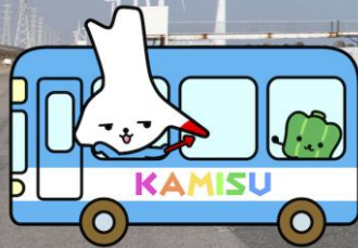
神栖市イメージキャラクター カミスココくん