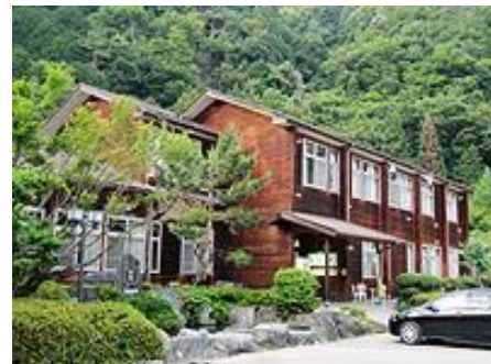
ヘルシー美里(旧早川北中学校校舎)

13:00 南アルプスプラザ(休憩) → 18:00頃 品川区役所 到着 ※凡例: → バス