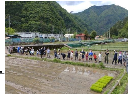
田植え体験(5月頃)のイメージ