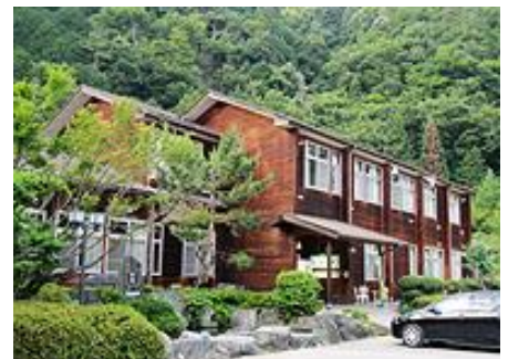
ヘルシー美里(旧早川北中学校校舎)