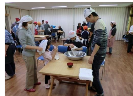
そば打ち体験のイメージ

※現在観光バスの車内空間は「外気導入モード」で前方と屋根上のエアコンから新鮮な空気を取り入れることにより、概ね5分で車内の空気が入れ替わります。