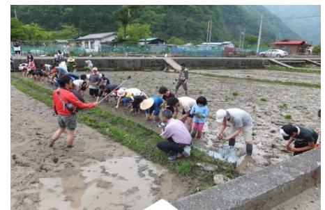
田植え体験(5月頃) ※写真はイメージです